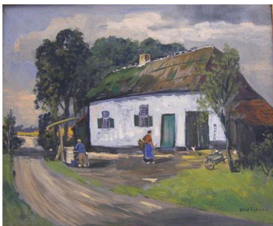
Boerderij in Genk (België) olieverf op doek, 50 x 60 cm, collectie: familie Godding